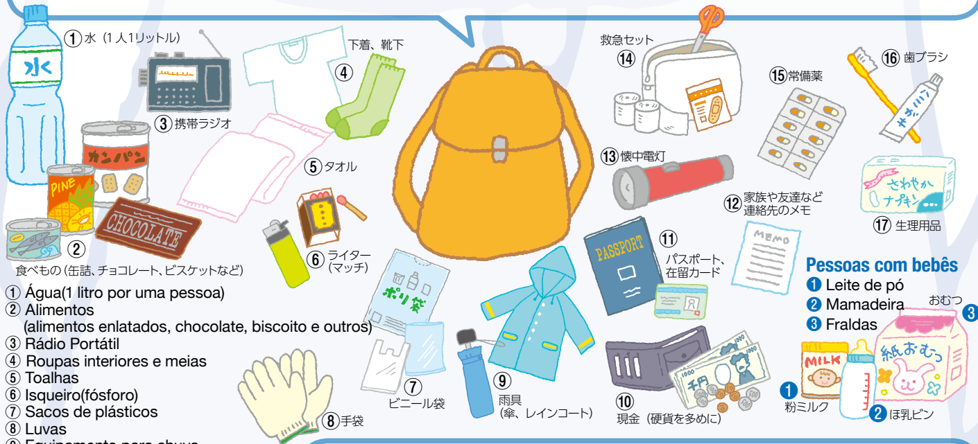
① 水 (1人1リットル)

ひなん に も だ 避難する<逃げる>ときに、すぐに持ち出すものをバックにまとめておきましょう。